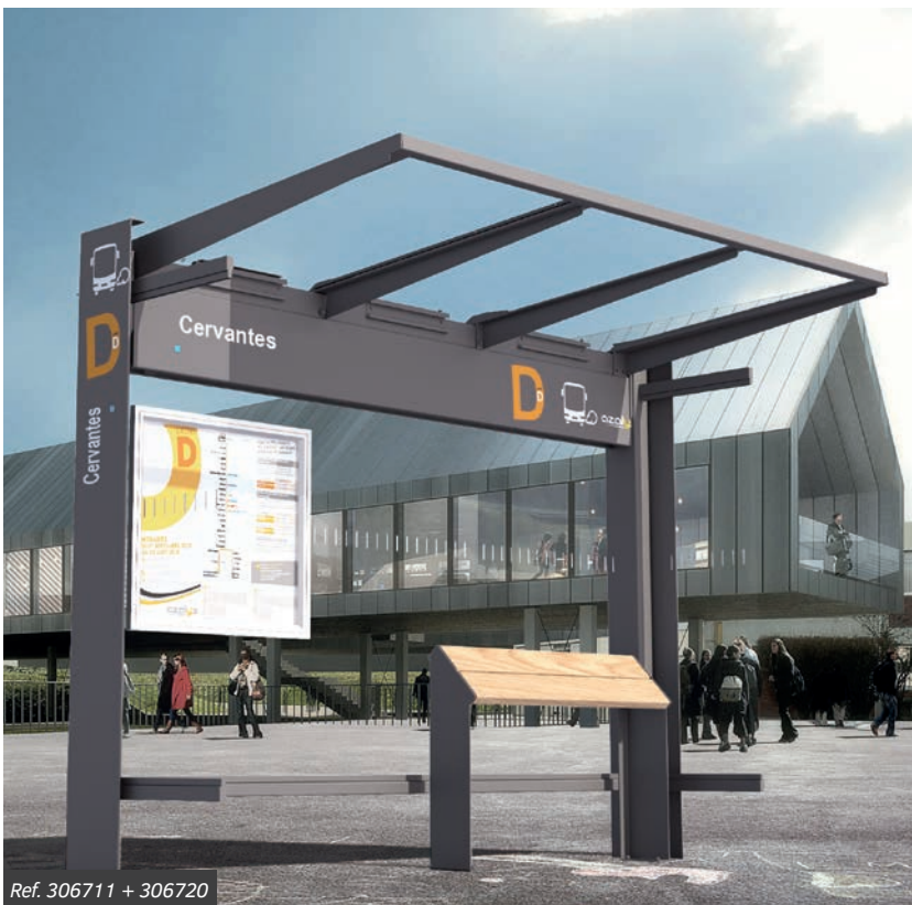
Ref. 306711 + 306720