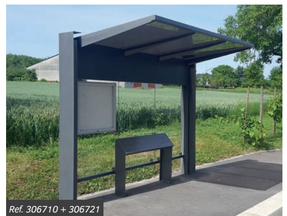
Ref. 306710 + 306721