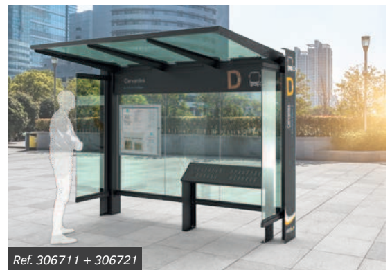
Ref. 306711 + 306721