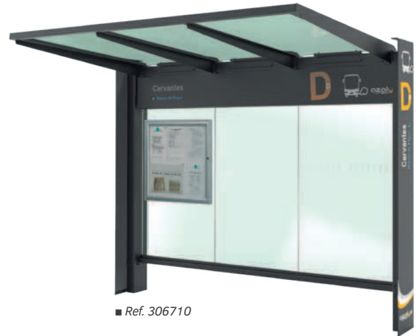
■ Ref. 306710