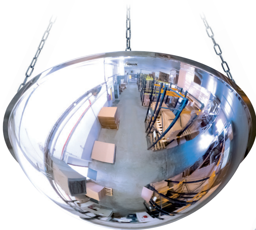
1/2 esfera de PMMA