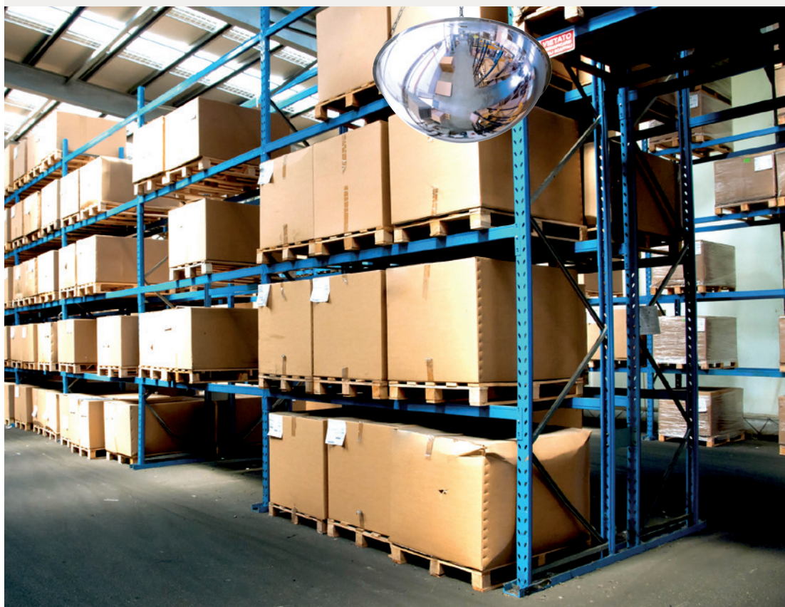
Modelo presentado ref. 3680 , Ø 800 mm