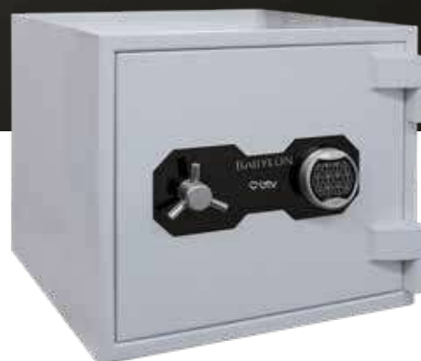
BABYLON 50 E