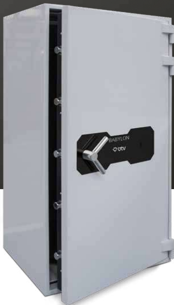
BABYLON 150 K